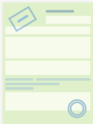
Страховой полис ОСАГО с электронной подписью

После оплаты в ваш личный кабинет и на e-mail придут электронные документы, которые вы можете распечатать: