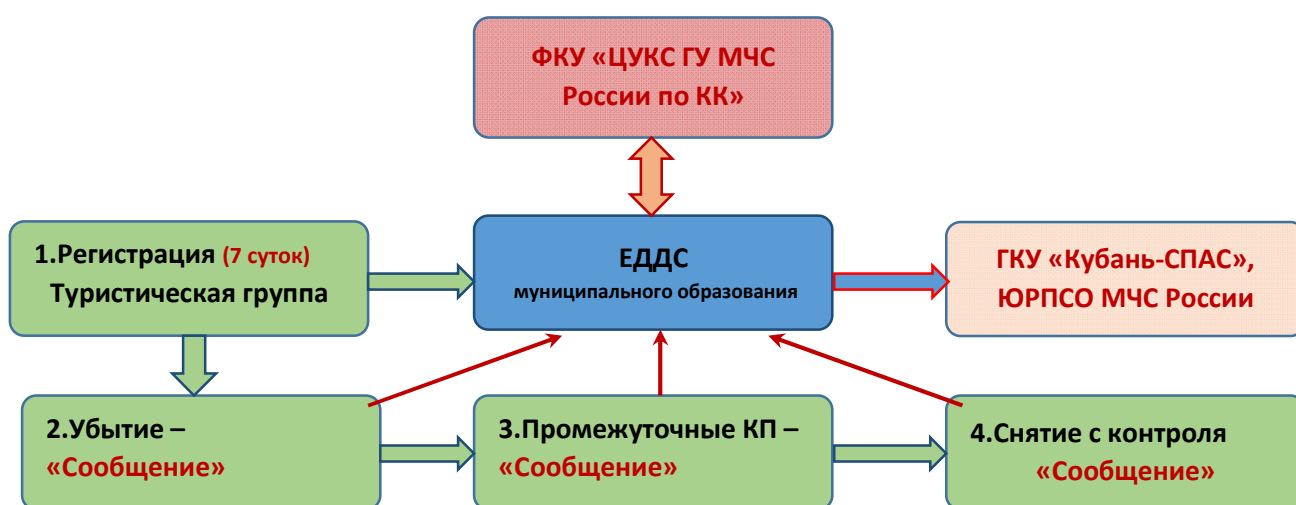
Рис.2 Схема регистрации и контроля

г) обеспечить общую координацию деятельности всех организаций по проведению поисково-спасательных работ и оказанию помощи туристам, терпящим бедствие, а так же организовать проведение необходимых послеаварийных мероприятий.